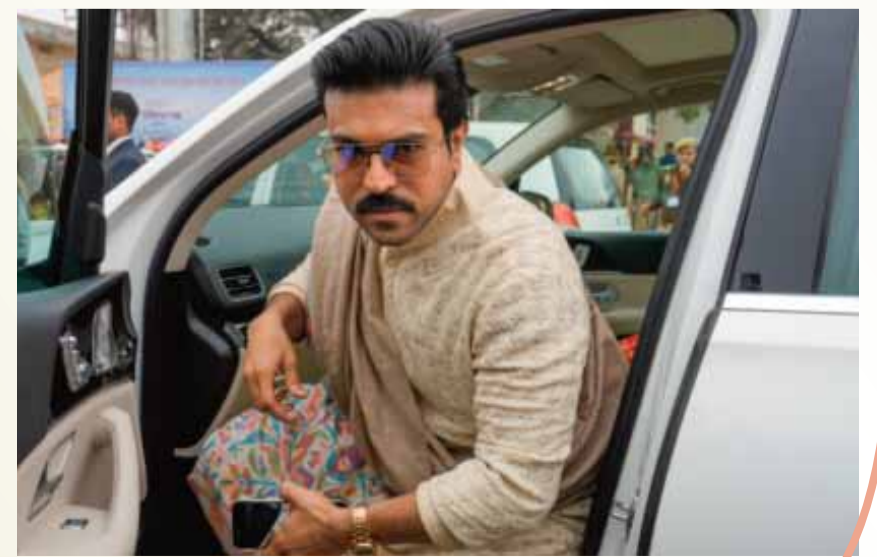
साथ अमिनेता रामचरण