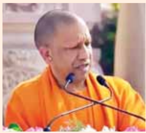
एजेसी ► अयोध्या

भारत का हर मार्ग रामजन्मभूमि की ओर आ रहा