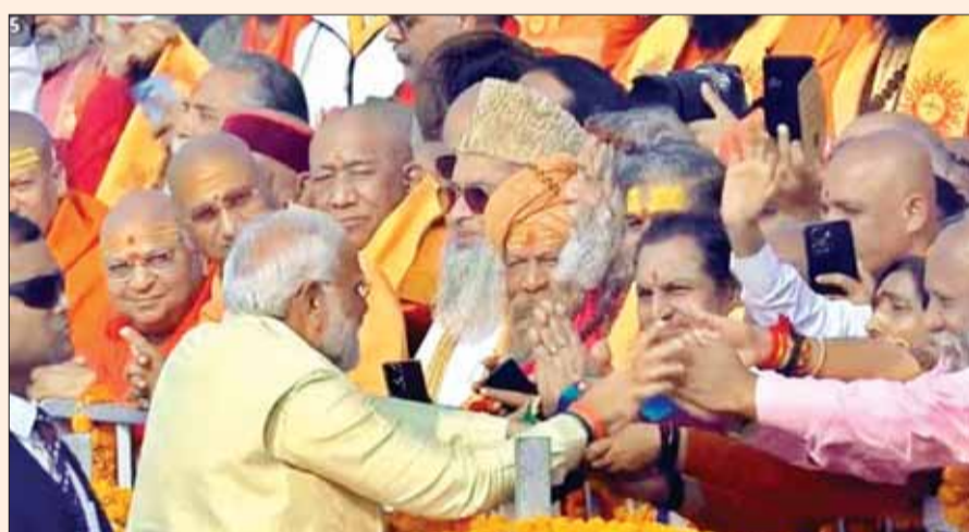
पीएम मोदी धर्मगुरुओं से मिले और उनसे बातचीत भी की।

पीएम मोदी ने कहा कि दिव्य कार्यक्रम का हिस्सा बनना मेरा परम सौभाग्य है। प्रधानमंत्री नरेंद्र मोदी राम मंदिर पहुंचे। पीएम मोदी रामलला के लिए चांदी का छत्र लेकर पहुंचे। पीएम मोदी रामलला के लिए पोशाक भी लेकर पहुंचे। हाथ में चांदी का छत्र लेकर पीएम मोदी ने राम मंदिर के गर्भगृह में प्रवेश किया। प्राण प्रतिष्ठान के के लिए अनुष्ठान शुरू हो गया है। राज्यपाल आनंदी बेन, सीएम योगी ने स्वागत किया। पीएम मोदी ने कुबेर टीला पर प्राचीन शिव मंदिर में की पूजा-अर्चना पीएम नरेंद्र मोदी ने रामलला की प्राण प्रतिष्ठा के बाद कुबेर टीला स्थित शिव मंदिर में पूजा-अर्चना की। अयोध्या में स्थित कुबेर टीला पर एक प्राचीन शिव मंदिर है। श्री राम मंदिर के निर्माण के साथ-साथ श्रीराम भूमि तीर्थ क्षेत्र ट्रस्ट ने इस मंदिर का भी पुनरोद्धार करवाया है। मान्यता है कि यहां धन के देवता कुबेर आए थे और टीले पर भगवान शंकर की पूजा के लिए शिवलिंग की स्थापना की थी। वहीं इस मंदिर में मां पार्वती, भगवान गणेश और कार्तिकेय की भी मूर्तियां हैं।