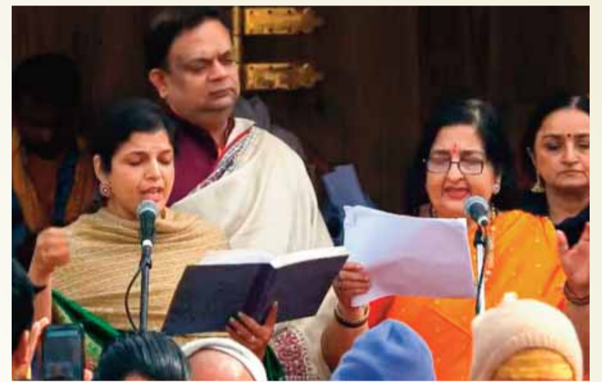
अनुराधा पौडवाल ने भजन प्रस्तुत किया।

राम मंदिर प्राण प्रतिष्ठा के बाद कंगना ने भी अपने आधिकारिक एक्स हैडल पर एक वीडियो साझा किया है। इसके कैप्शन में उन्होंने लिखा, 'राम आ गए हैं।' वीडियो में कंगना जोर-जोर से 'जय श्री राम' के नारे लगाते हुए नजर आईं। इससे पहले कंगना ने अपनी कुछ तस्वीरें साझा कर राम मंदिर प्राण प्रतिष्ठा समारोह की झलक दिखाई थीं।