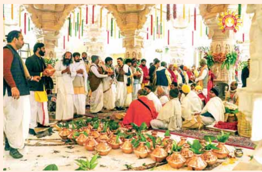
प्राण-प्रतिष्ठा के पहले कलाकारों और साधु-संतों ने अपनी प्रस्तुति दी।

केंद्रीय मंत्री जितेंद्र सिंह ने कहा कि अयोध्या राम मंदिर की एक अनूठी विशेषता है कि यहां हर नवमी को सूर्यदेव स्वयं रामचंद्र के माथे पर तिलक लगाएंगे। सिंह ने आगे कहा कि राम मंदिर के निर्माण के दौरान इस बात का खास ध्यान रखा गया है कि हर साल श्रीराम नवमी के दिन दोपहर के समय सूर्य की किरणें भगवान राम की मूर्ति के माथे पर लगभग 6 मिनट तक पड़े। सिंह ने कहा कि बंगलुरु की इंडियन इंस्टीट्यूट ऑफ एस्ट्रॉफिजिक्स ने सूर्य के पथ और ऑप्टिका पर अपनी मंदिर निर्माण के दौरान टैलिनकल सहायता दी है। उन्होंने कहा, गिरबॉक्स और रिफ्लेक्टिव मिरर/लेंस की व्यवस्था इस तरह की गई है कि शिकारा के पास तीसरी मंजिल से सूर्य की किरणों को सूर्य के पथ पर नजर रखकर गर्म गूठ तक लाया जाएगा।