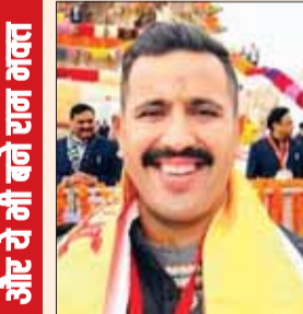
आर्ये भी लने राम मंत्र