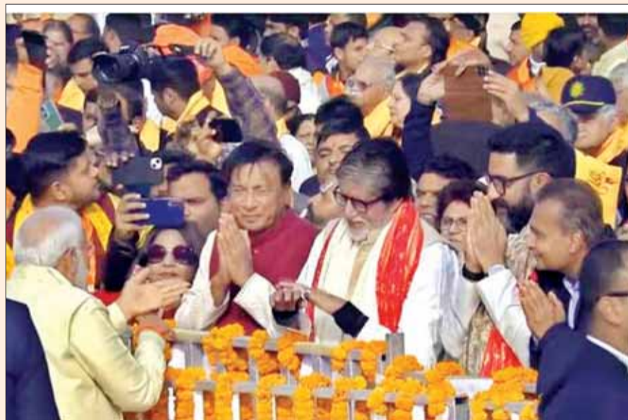
पीएम मोदी से बात करते मेगा स्टार अमिताभ बच्चन और अन्य दिग्गज हस्तियां।